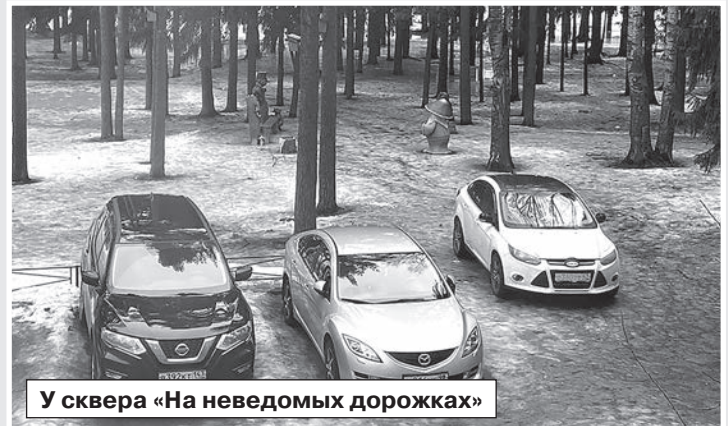
У сквера «На неведомых дорожках»

Благодаря бдительности и гражданской активности сердоловчан наша традиционная рубрика «Автохамы» пополняется новыми присланными читателями снимками. Что же заставляет водителей нарушать правила дорожного движения? Незнание, ослепляющее солнце или просто наплевательское отношение к людям?