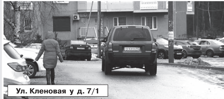
Ул. Кленовая у д. 7/1