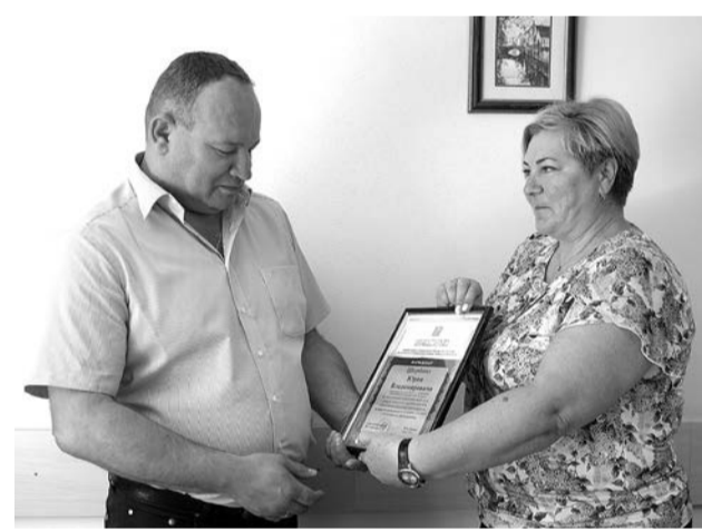
Подготовила Мария ВОРОНИНА

12 июля Юрию Владимировичу исполняющая обязанности главы ад-