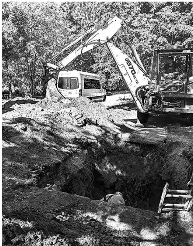
ной Речке и № 17 на улице Заречной.

– замена водопроводных вводов в многоквартирные жилые дома № 14 и № 21 на Чёр-