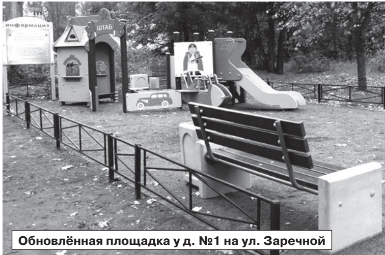
Обновлённая площадка у д. №1 на ул. Заречной