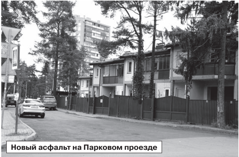
Новый асфальт на Парковом проезде