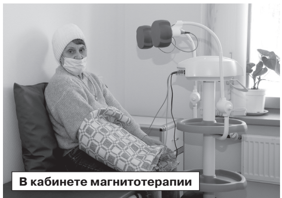
В кабинете магнитотерапии