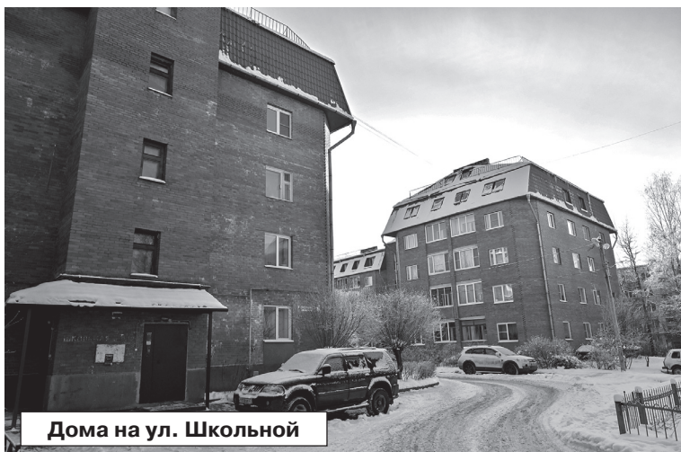
Дома на ул. Школьной