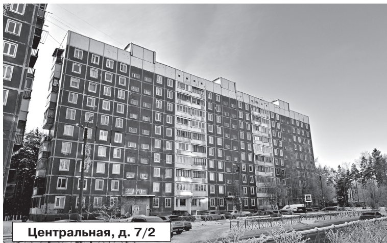
Центральная, д. 7/2