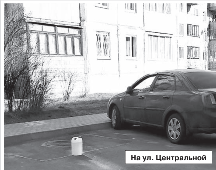
На ул. Центральной