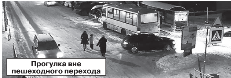
Прогулка вне пешеходного перехода

Сертоловчане разных возрастов переходят дорогу в любом приглянувшемся им месте. На прошлой неделе под бдительное око камеры попало семейство, которое, лавируя между движущимися автомобилями на ул. Ларина, во главе с женщиной держали путь до супермаркета. Между тем для удобства и безопасности горожан были обустроены 2 пешеходных перехода у конечной остановки маршрута 555 и у пиццерии.