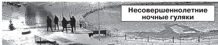
Несовершеннолетние ночные гуляки

ВИДЕОКАМЕРЫ ЕЖЕМИНУТНО ФИКСИРУЮТ ЖИЗНЬ СЕРТОЛОВО