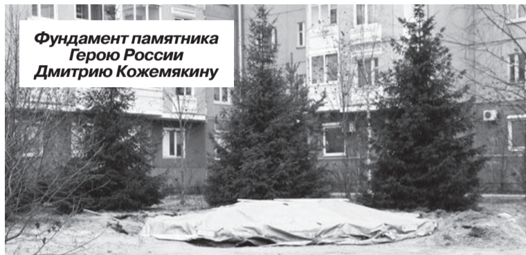
Фундамент памятника Герою России Дмитрию Кожемякину

Материалы подготовила Мария ВОРОНИНА