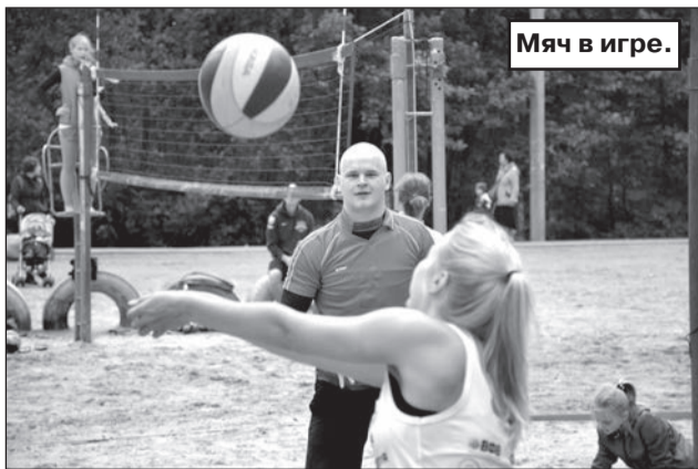
Мяч в игре.