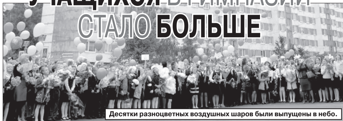
Десятки разноцветных воздушных шаров были выпущены в небо.

СОСТОЯЛАСЬ ЧЕТЫРНАДЦАТАЯ ЛИНЕЙКА В ЧЕСТИ НАЧАЛА НОВОГО УЧЕБНОГО ГОДА