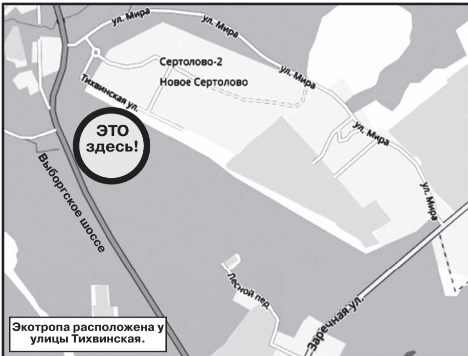
Экотропа расположена у улицы Тихвинская.