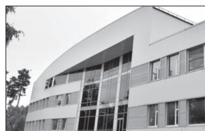
Спортивно-оздоровительный центр на ул. Дм. Кожемякина.

ВОЗМОЖНО, В СЕРТОЛОВО ПОЯВИТСЯ ДЕТСКО-ЮНОШЕСКАЯ СПОРТИВНАЯ ШКОЛА.