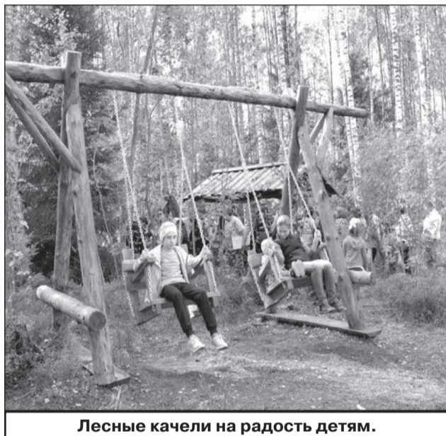
Лесные качели на радость детям.

В процессе обслуживания первой очереди нового микрорайона