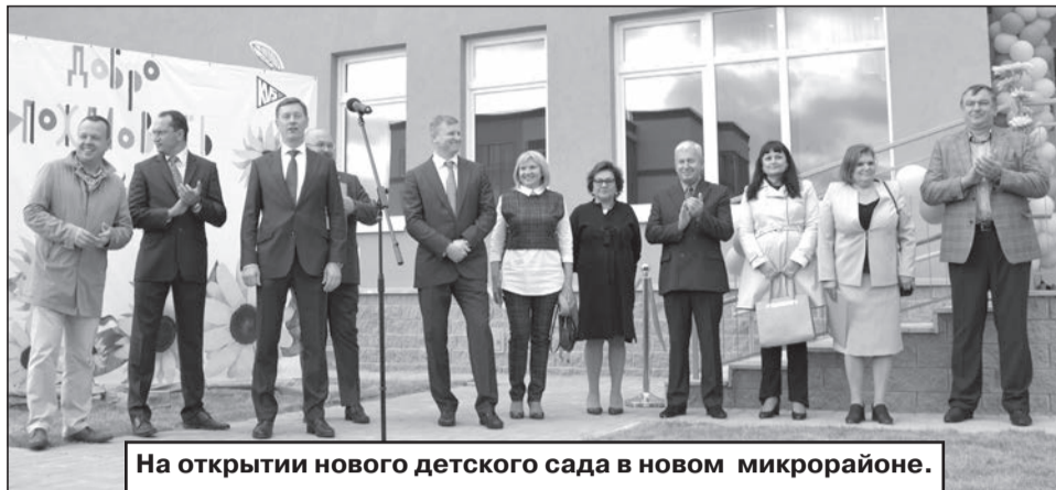
На открытии нового детского сада в новом микрорайоне.