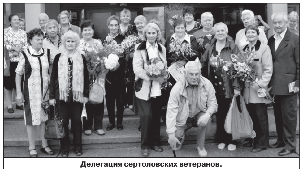
Делегация сертоловских ветеранов.