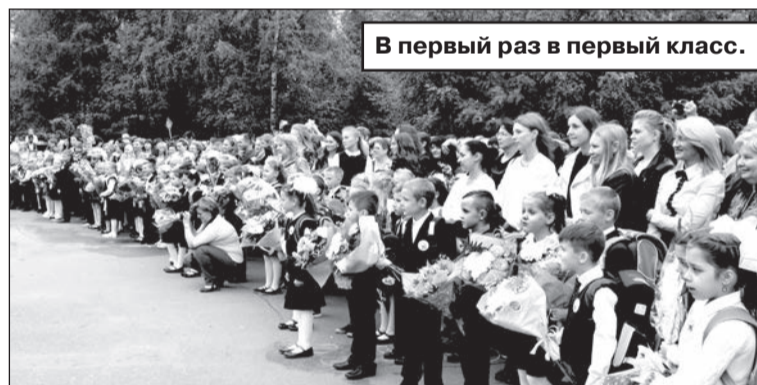
В первый раз в первый класс.

- Особенности слова, конечно, хочется сказать первоклассникам, для которых сегодня открылись двери в удивительную школьную страну знаний и прозвенел первый звонок, - подчеркнул Сергей Васильевич. - Желаю всем ученикам высоких достижений в учёбе, интересных и ярких страниц в школьной жизни. И пусть новый учебный год для каждого станет успешным, особенно для выпускников, которым предстоит очень важный, решающий, заключительный год учёбы. Учителям же хочется пожелать выдержки, настойчивости и терпения в достижении поставленных целей.