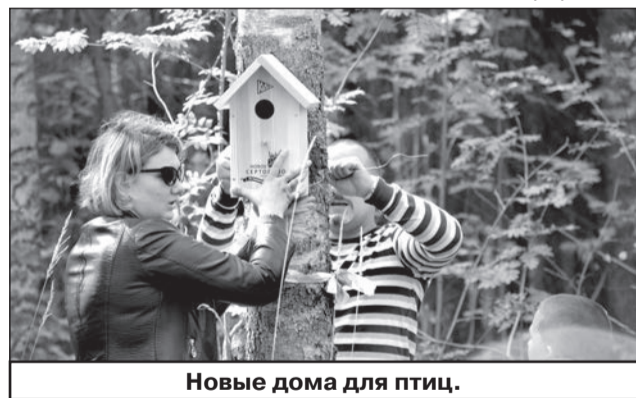
Новые дома для птиц.

Подготовила Виктория НОЖЕНКО