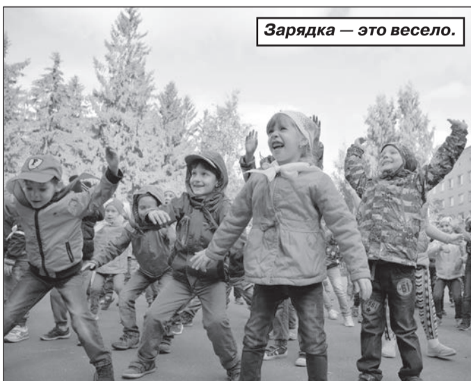
Зарядка — это весело.