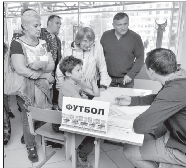
Идёт запись в спортивные секции.

В нашем городе совет депутатов и администрация уделяют особое внимание развитию физической культуры и спорта, реализуя целевую муниципальную программу. И хочется пожелать всем маленьким спортсменам, выбравшим свою секцию или от-