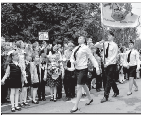
Торжественный вынос знамени школы.