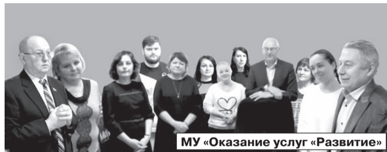
МУ «Оказание услуг «Развитие»