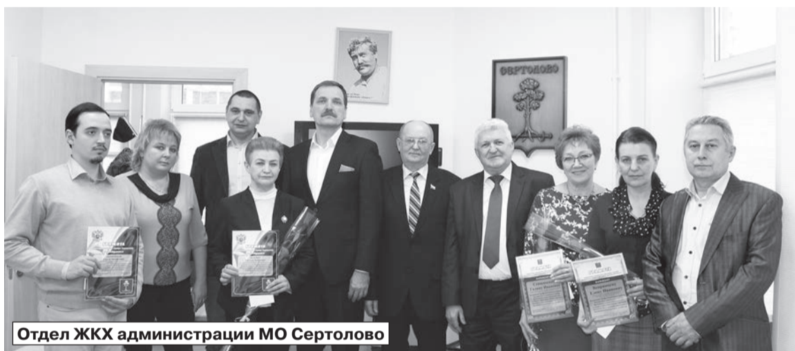
Отдел ЖКХ администрации МО Сертолово