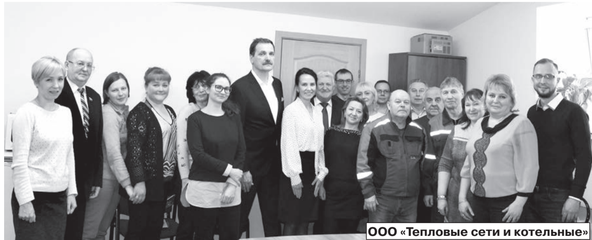
ООО «Тепловые сети и котельные»