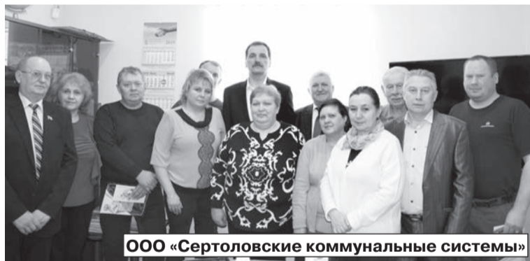
ООО «Сертоловские коммунальные системы»