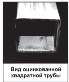
Вид оцинкованной квадратной трубы