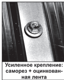
Усиленное крепление: саморез + оцинкованная лента