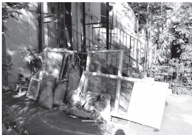
Ул. Центральная, д. 3