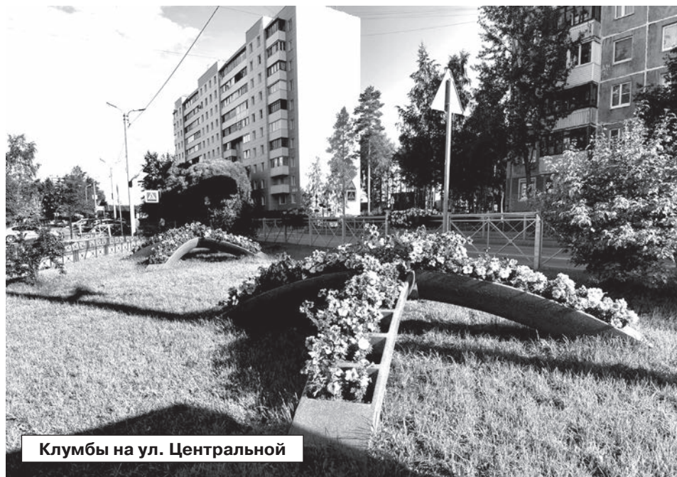
Клумбы на ул. Центральной

До празднования Дня города остаются считанные дни. И можно с полной уверенностью сказать, что Сертолово подошёл к этой дате во всей красе.