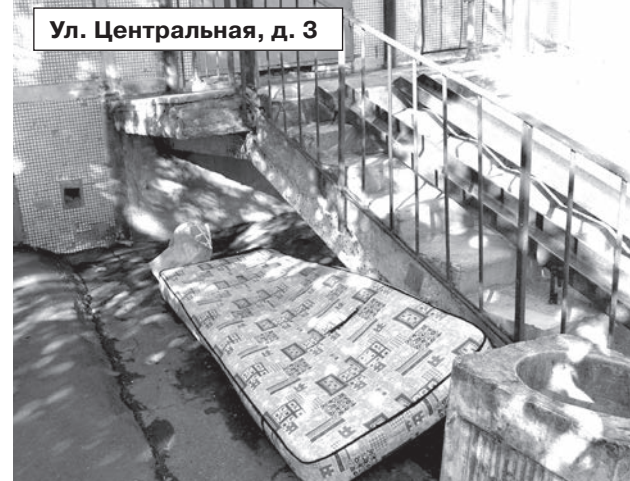
Ул. Центральная, д. 3