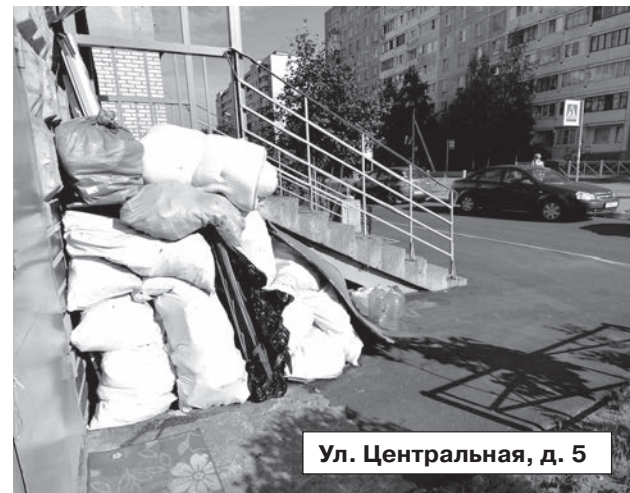
Ул. Центральная, д. 5