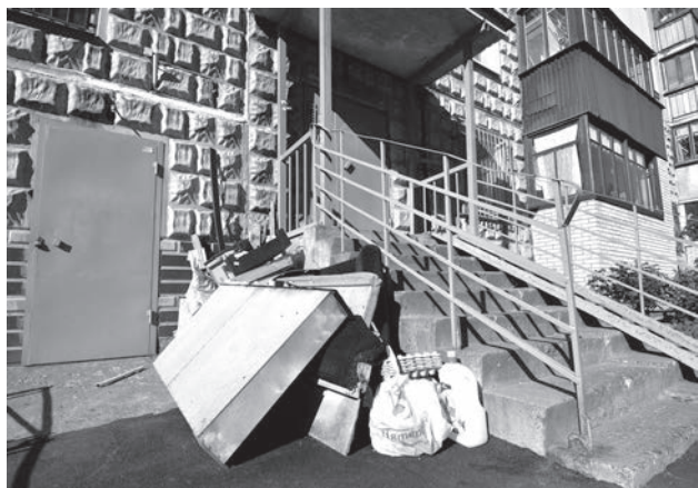
Ул. Центральная, д. 5