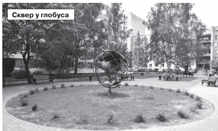
Сквер у глобуса