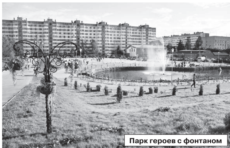
Парк героев с фонтаном

НОВЫЕ ОБЪЕКТЫ БЛАГОУСТРОЙСТВА ПОЯВЯТСЯ В СЕРТОЛОВО