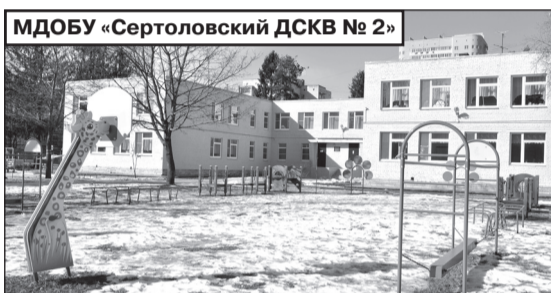
МДОБУ «Сертоловский ДСКВ № 2»