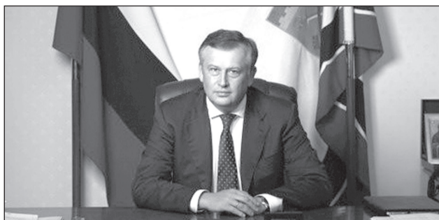
ОБРАЩЕНИЕ губернатора Ленинградской области Александра Дрозденко в связи с Днем партизанской славы