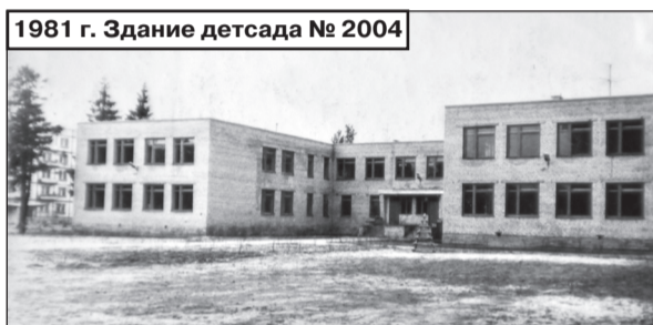
1981 г. Здание детсада № 2004