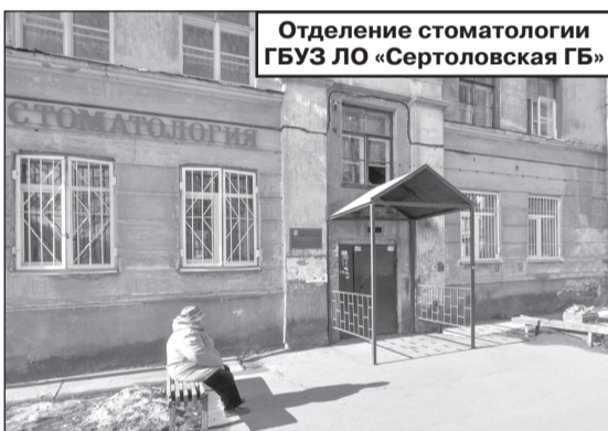
Отделение стоматологии ГБУЗ ЛО «Сертоловская ГБ»