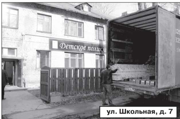
ул. Школьная, д. 7