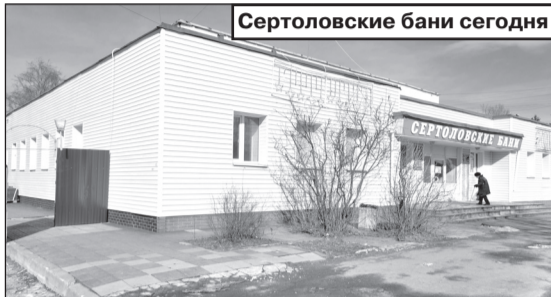
Сертоловские бани сегодня