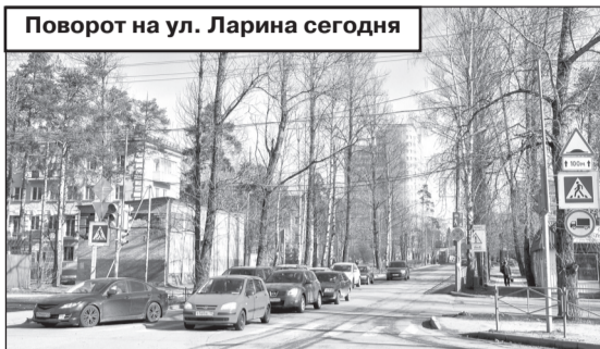
Поворот на ул. Ларина сегодня