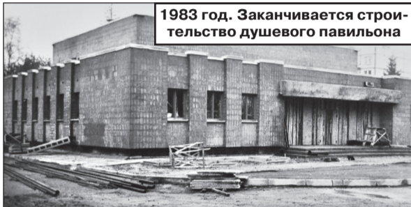
1983 год. Заканчивается строительство душевого павильона