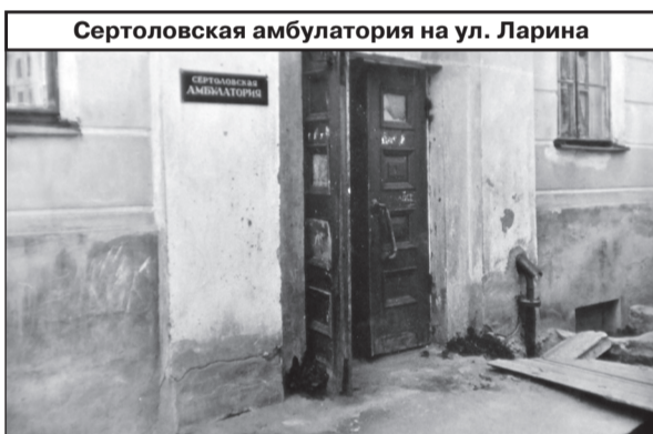
Сертоловская амбулатория на ул. Ларина