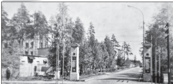
Поворот на ул. Ларина в наш городок в 1960-е годы

20 августа наш город Сертолово отметит свое 80-летие. По человеческим меркам это солидный и почтенный возраст. Но для города это лишь этап большого пути. Сертолово растет и развивается, меняется буквально на наших глазах.