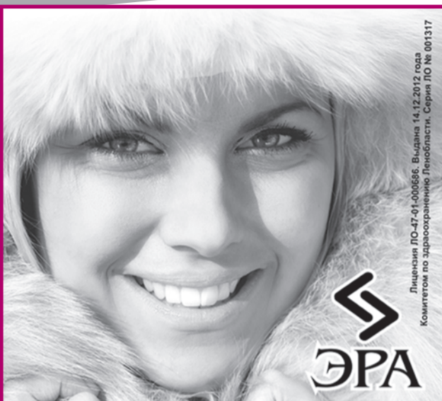
Лицензия ЛО-47-01-000566. Выдана 14.12.2012 года Комитетом по административным территориям, Сервис ЛО № 001317

Обращаться по тел.: 593-85-24 (роб. 100).