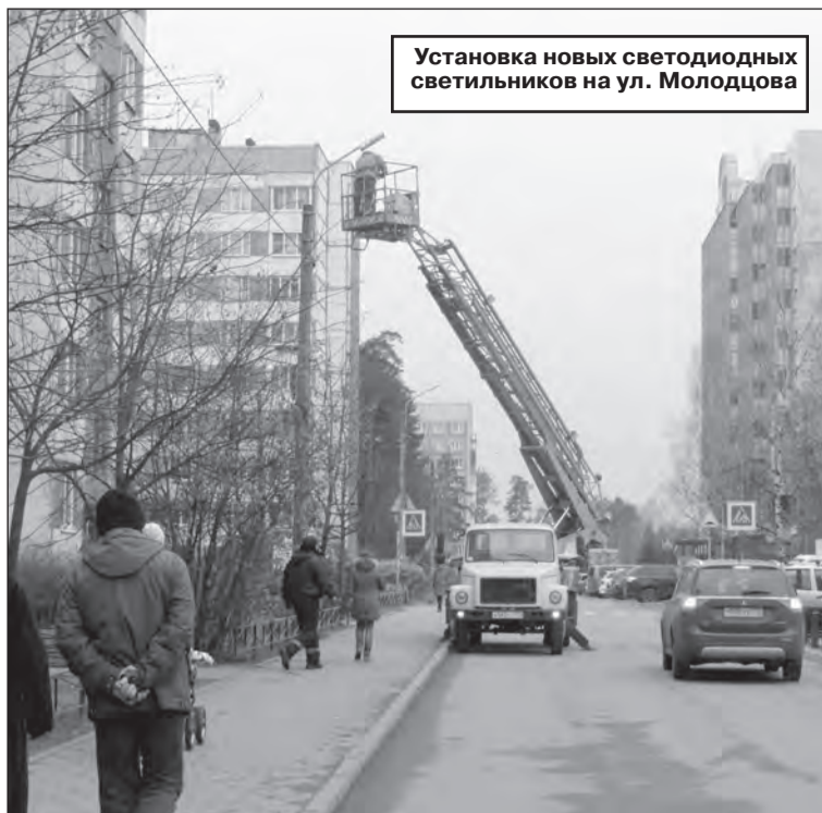
Установка новых светодиодных светильников на ул. Молодцова

- До конца ноября пройдет закупка и определится победитель аукциона по украшению города к празднику. Будут закуплены светодиодные гирлянды – более яркие и красивые, чем те, что были на сертоловских улицах в предыдущие годы. И важно знать мнение горожан, с