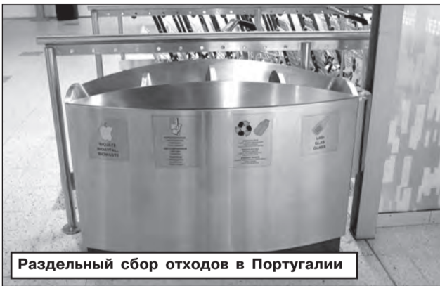
Раздельный сбор отходов в Португалии