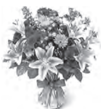
СОВЕТ ОО «ДЕТИ ВОЙНЫ»

В этот день грустить не надо, Что ж, пускай бегут года, День рожденья как награда, Дорогая нам всегда!!!