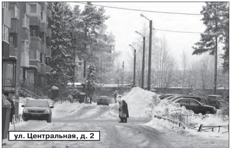
ул. Центральная, д. 2