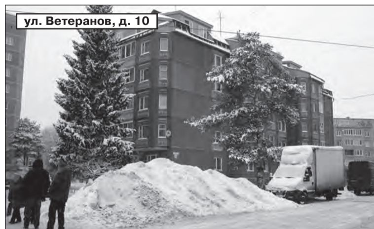
ул. Ветеранов, д. 10