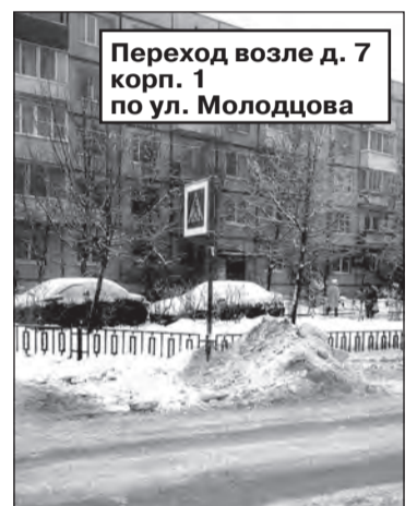
Переход возле д. 7 корп. 1 по ул. Молодцова