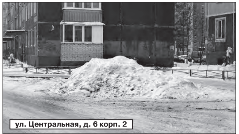
ул. Центральная, д. 6 корп. 2