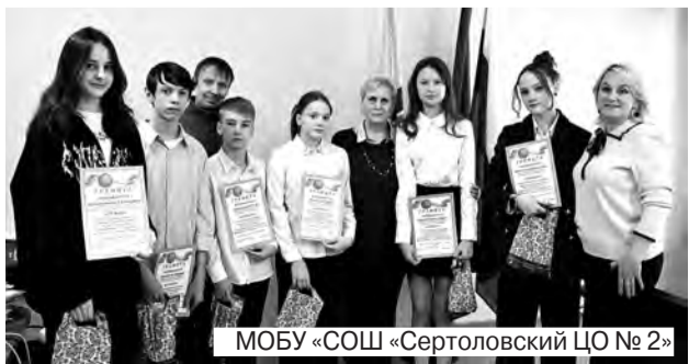
МОБУ «СОШ «Сертоловский ЦО № 2»