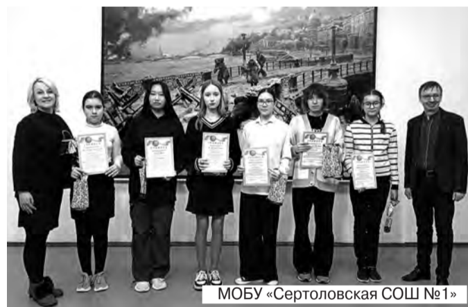
МОБУ «Сертоловская СОШ №1»