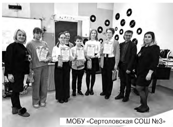
МОБУ «Сертоловская СОШ №3»