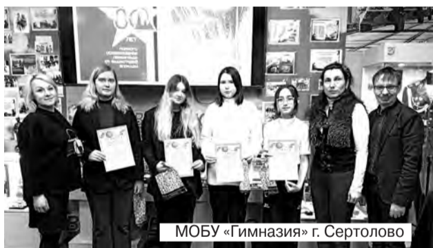
МОБУ «Гимназия» г. Сертолово

С 3 по 23 января в нашем городе проводился Международный конкурс рисунков, посвященный 80-летию со Дня полного освобождения Ленинграда от фашистской блокады (1944) в рамках муниципальной программы «Молодое поколение МО Сертолово» на 2020-2024 годы.