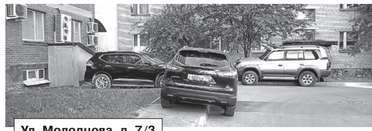
Ул. Молодцова, д. 7/3