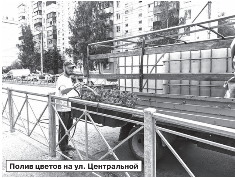
Полив цветов на ул. Центральной

Подрядная организация регулярно занимается поливом всех растений в городе. Но некоторые кустарники и деревья всё же не смогли пережить аномально жаркую и засушливую погоду. Те растения, которые в ближайшее время не удастся вернуть к здоровому состоянию, осенью будут заменены на новые зелёные насаждения.