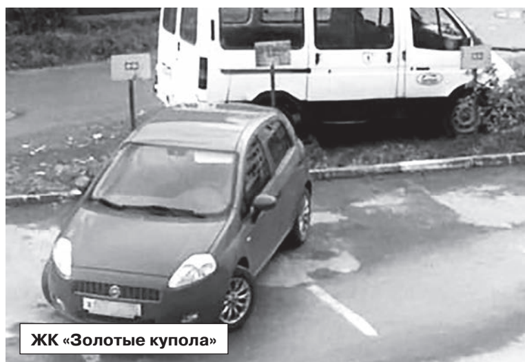
ЖК «Золотые купола»