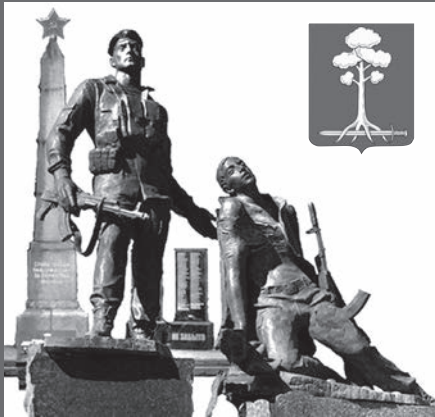
МУНИЦИПАЛЬНОЕ ОБРАЗОВАНИЕ СЕРДОЛОВО