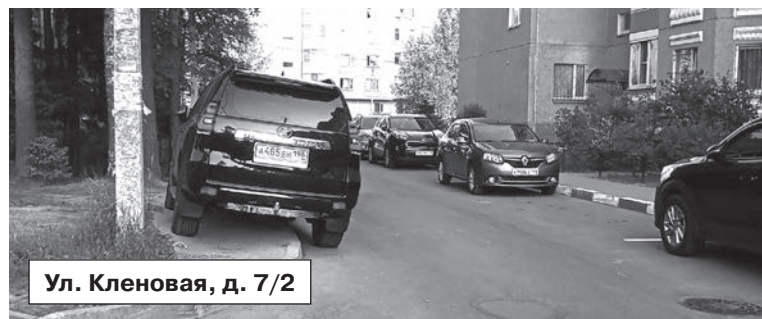
Ул. Кленовая, д. 7/2