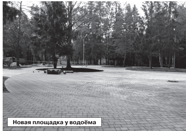
Новая площадка у водоёма

чение сигналов которого будет обеспечивать специальный дорожный кон-