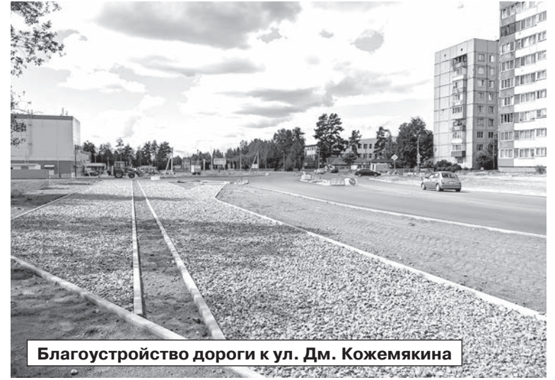
Благоустройство дороги к ул. Дм. Кожемякина