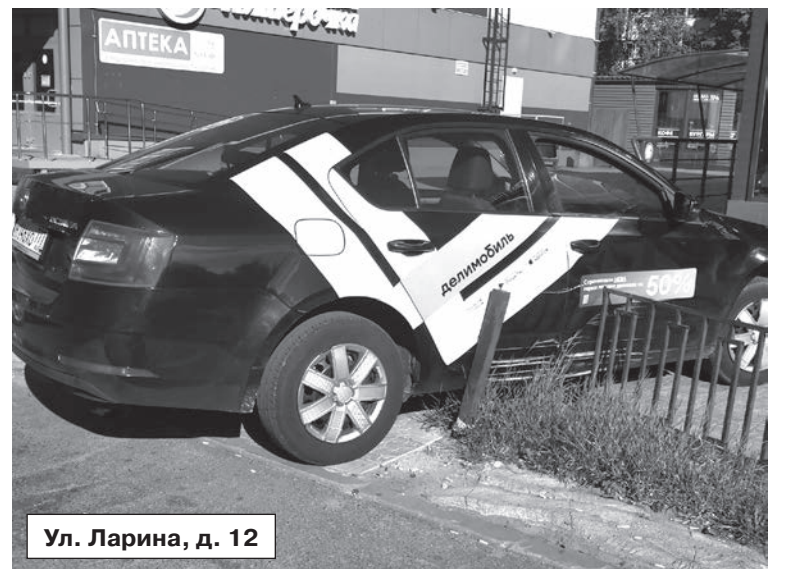
Ул. Ларина, д. 12

В ЖК «Новое Сертолово» живёт чудо-водитель, который не чувствует габаритов и задевает чужие автомобили. И это, увы, не единичный случай. Проблема ещё в том, что смелости признать свою вину у него не хватает, и вычислять нарушителя прихо-