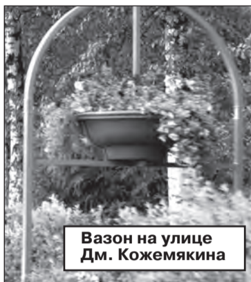
Вазон на улице Дм. Кожемякина

- Действительно, на этом участке дороги поломка элементов ИДН - «лежачего полицейского» происходит уже не в первый раз. Устраняет поломки подрядная организация за счет собственных средств. В связи с этим просим жителей Сертолово, ставших свидетелями разрушения ИДН, сообщать об этом в редакцию газе-