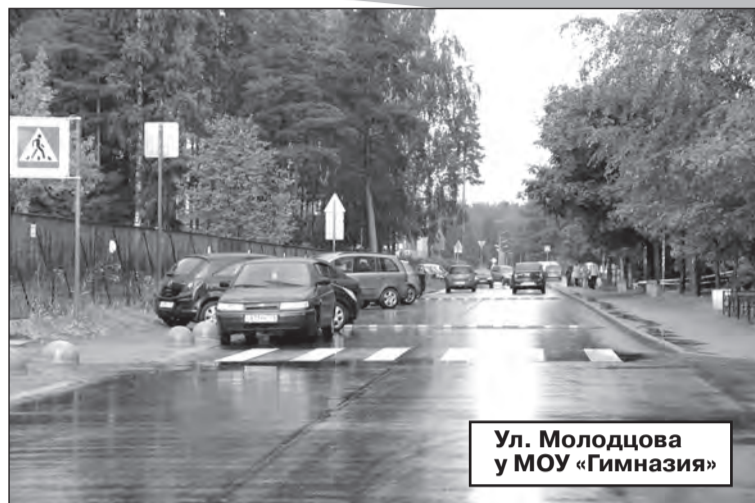
Ул. Молодцова у МОУ «Гимназия»

Под контролем совета депутатов длительное время администрация муниципального образования Сертолово вела переписку с департаментом имущества Министерства обороны РФ об участках земли под строительство канализационных коллекторов в двух микрорайонах нашего муниципалитета: Сертолово-2 и Черная Речка. Давно известно, что строительство канализационных коллекторов здесь является острой необходимостью. Старания городских властей увенчались успехом. Департамент имуществен-