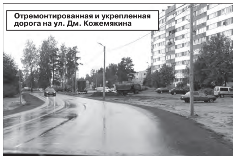
Отремонтированная и укрепленная дорога на ул. Дм. Кожемякина

ных отношений передал МО Сертолово эти участки в безвозмездное срочное пользование сроком на 11 месяцев. После проведения всех необ-