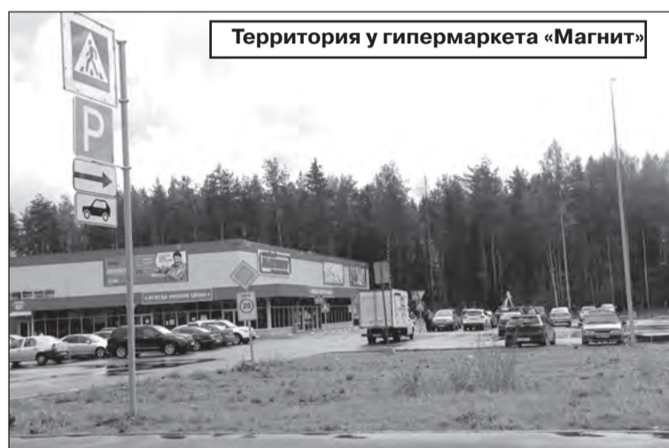
Территория у гипермаркета «Магнит»