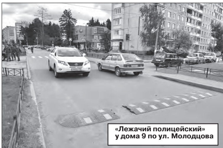
«Лежачий полицейский» у дома 9 по ул. Молодцова