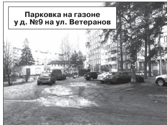
Парковка на газоне у д. №9 на ул. Ветеранов