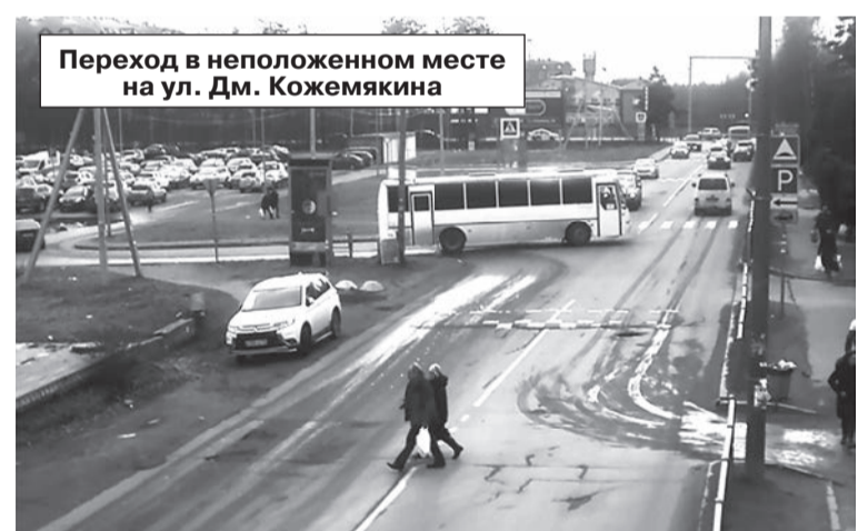
Переход в неполюженном месте на ул. Дм. Кожемякина

ЖИТЕЛИ ГОРОДА НЕ ЛЮБЯТ ПРАВИЛА И ОГРАНИЧЕНИЯ