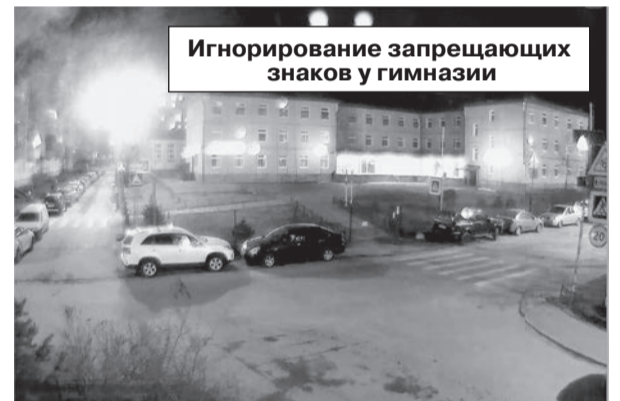
Игнорирование запрещающих знаков у гимназии

Город, несмотря на все перипетии непростой истории нашей страны, на искусственно раздутый ажиотаж вокруг нового вируса и скачков цен на нефть, продолжает планомерно развиваться и вести спокойную жизнь. И ничто не мешает её размеренному течению. Кроме, разве что, самих горожан, которые игнорируют элементарное правило социума – взаимоуважение.