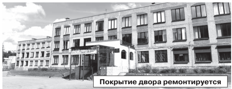
Покрытие двора ремонтируется