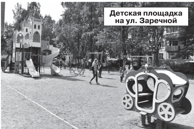
Детская площадка на ул. Заречной

что подростки, которые проводят здесь свободное время, проявляют вполне взрослую ответственность: сами следят за состоянием площадки и оборудования. А в 2016 году они обратились к совету депутатов и администра-