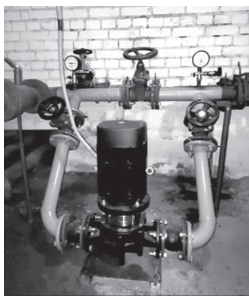
Установка автоматического повышения давления в подвале жилого дома

Выполнена замена водопроводного ввода дома 1 микрорайона Чёрная Речка. Ветхий чугунный водопровод заменён на трубу из полиэтилена - со-