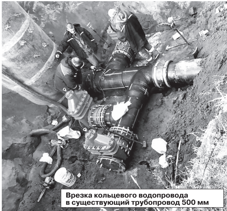
Врезка кольцевого водопровода в существующий трубопровод 500 мм

Горячая пора работ по приведению всего большого коммунального хозяйства Сертолово в готовность перед долгими холодами идёт полным ходом. Летняя страда сертоловских коммунальщиков не прекращается ни на один день. Специалисты ООО «Сертоловские коммунальные системы» рассказали «Петербуржскому рубежу», какие работы уже произведены на сегодняшний день и что запланировано на будущее.