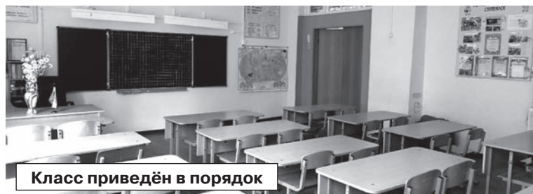
Класс приведён в порядок