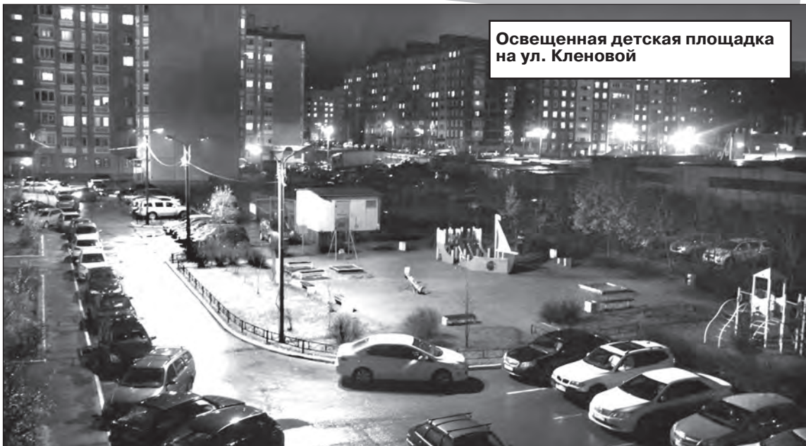
Освещенная детская площадка на ул. Кленовой