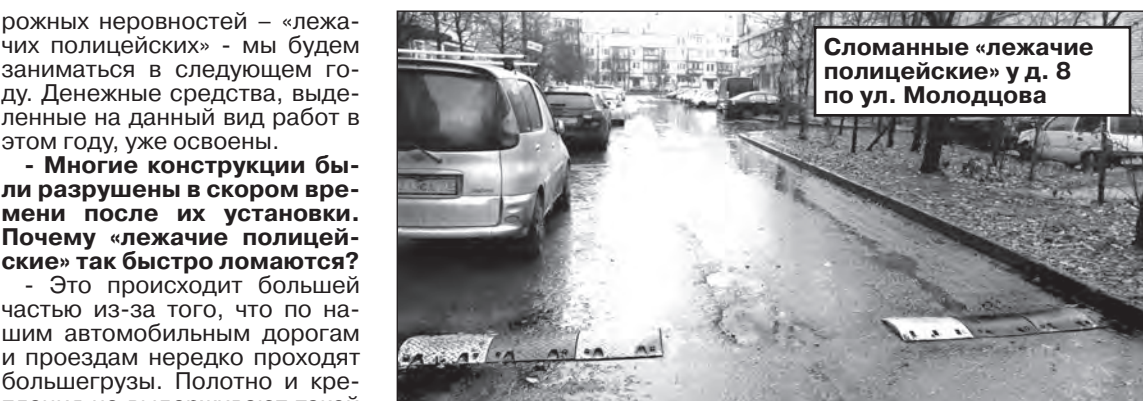
Сломанные «лежащие полицейские» у д. 8 по ул. Молодцова

рожных неровностей - «лежащих полицейских» - мы будем заниматься в следующем году. Денежные средства, выделенные на данный вид работ в этом году, уже освоены.