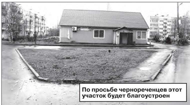
По просьбе чернореченцев этот участок будет благоустроен