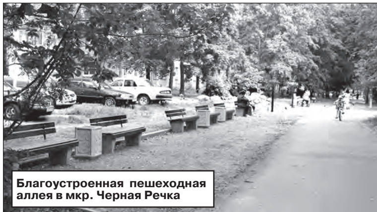
Благоустроенная пешеходная аллея в мкр. Черная Речка