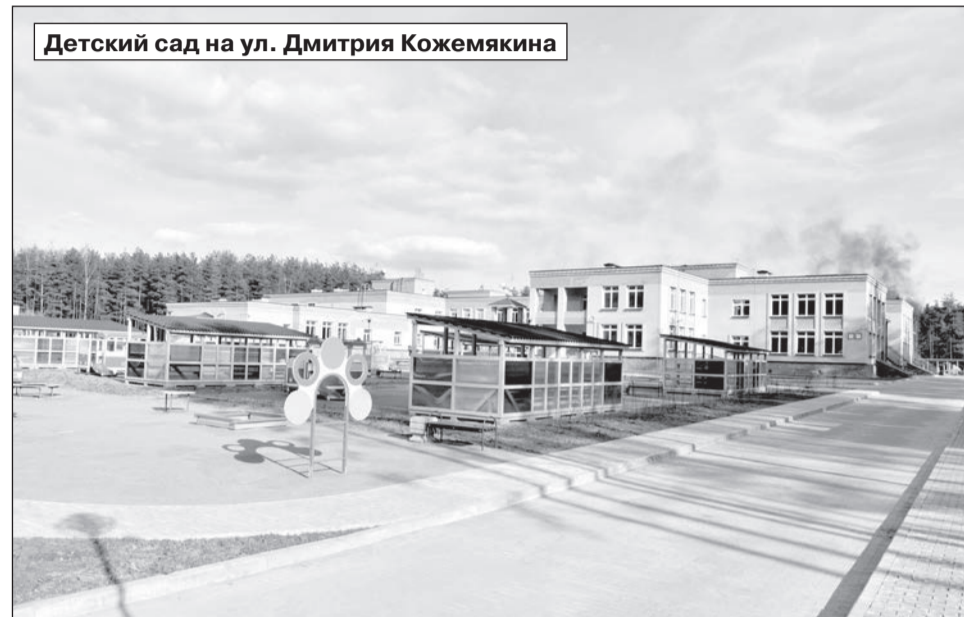
Детский сад на ул. Дмитрия Кожемякина