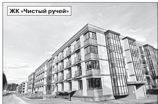
ЖК «Чистый ручей»