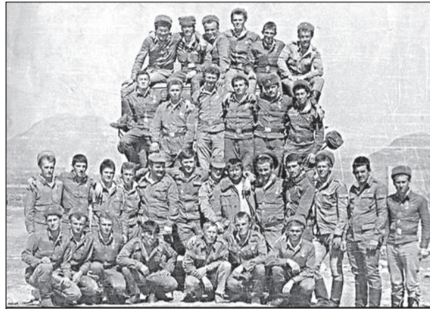
Фото на память. Афганистан

Рота занималась подвозом материальных средств для всех воинских частей дивизии. Она имела своё название: «колонна № 157». В неё входили 3 взвода подвоза и хозяйственный взвод, в штате которого было 9 складов. Вся служба проходила «на колёсах». Перевал Саланг я хоть сейчас могу пройти пешком с закрытыми глазами, настолько врезалась в память каждая деталь. Каждый раз колонну сопровождало боевое охранение — два КАМАЗа с зенитными установками. Перед рейсом обязательно нужно было опробовать работу зениток, иначе колон-