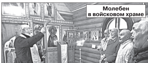
Молебен в войсковом храме