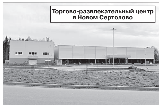
Торгово-развлекательный центр в Новом Сертолово