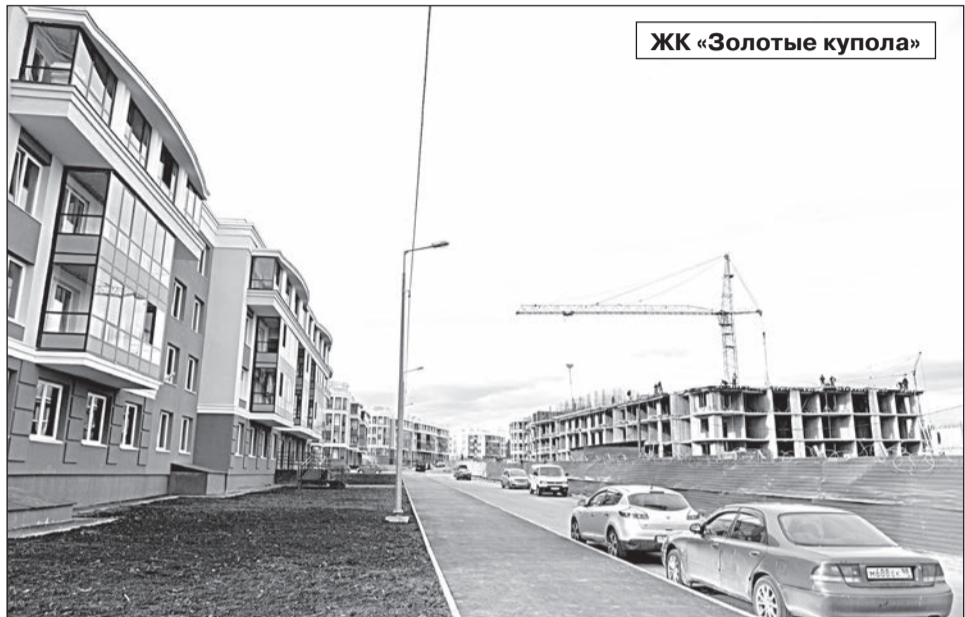
ЖК «Золотые купола»