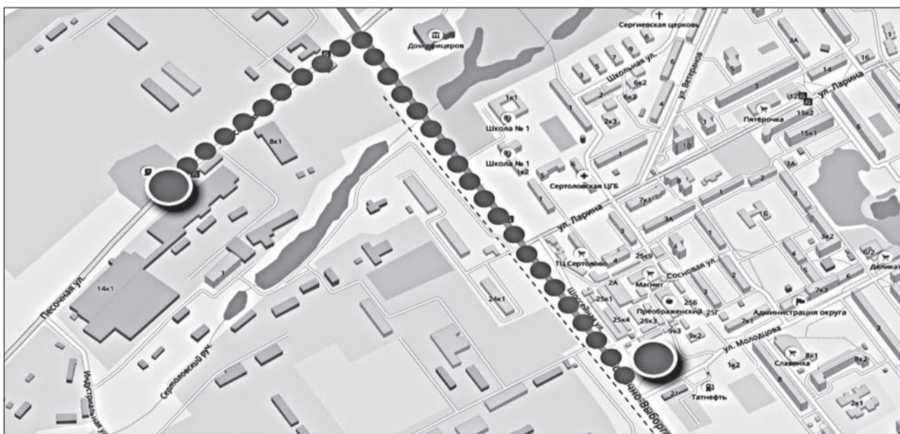
СХЕМА ДВИЖЕНИЯ ПРАЗДНИЧНОЙ КОЛОННЫ 9 МАЯ