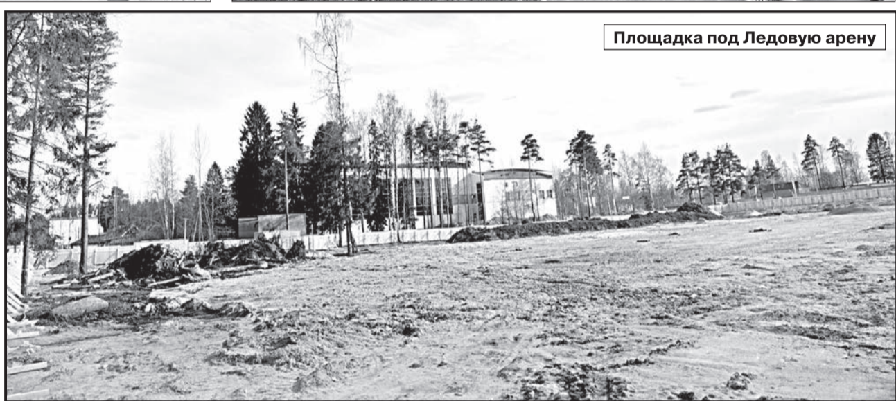
Площадка под Ледовую арену

Надо ехать в Питер, как только захотелось погонять с друзьями в хоккей или просто покататься на коньках? Совсем скоро эта проблема будет решена: за домами № 9 и № 8 по улице Молодцова расположена площадка, отведённая под строительство крыто-