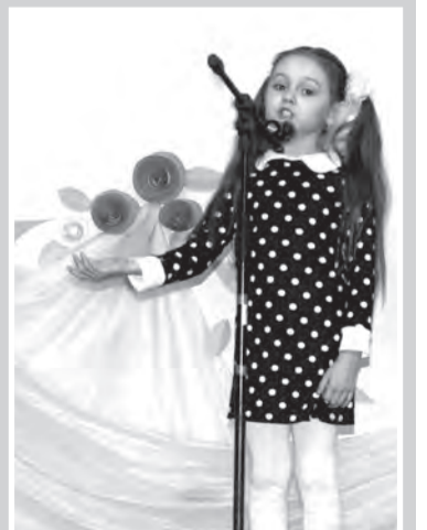
ции МО Сертолово в рамках муниципальной программы «Развитие культуры в МО