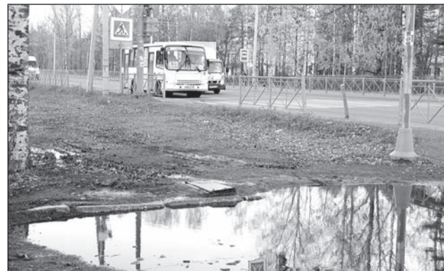
нет никакой информации по этому поводу и комментариев нам никаких не дадут. «Петербургский рубез» будет держать ситуацию

На место «стройки» остались снесённые ограждения и ямы, следы от колёс тяжёлой техники, в которых в такую погоду скапливается немало воды, образуя огромные лужи.