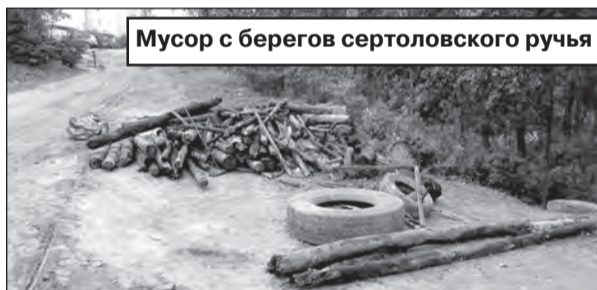
Мусор с берегов сертоловского ручья

Волонтеры движения «Чистый Сертолово» приняли решение выйти на субботник и очистить