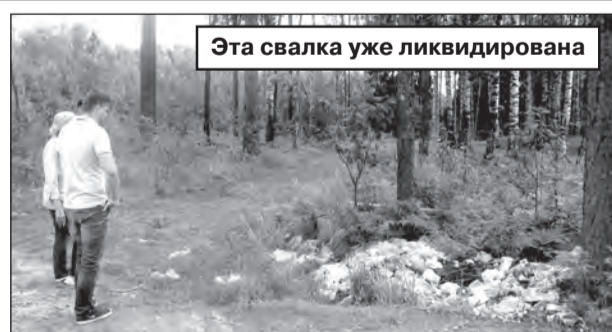
Эта свалка уже ликвидирована

Большая проблема для экологической безопасности многих населенных пунктов – несанкционированные свалки. Зачастую в нашем городе мусором заваливаются многочисленные овраги в лесу. Причем люди, и правда, воспринимают такие места как свалки.