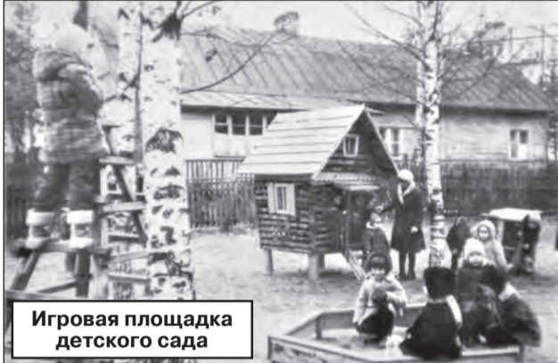
Игровая площадка детского сада

В 1975 г. Сертолово. На ул. Школьной открыт детский сад