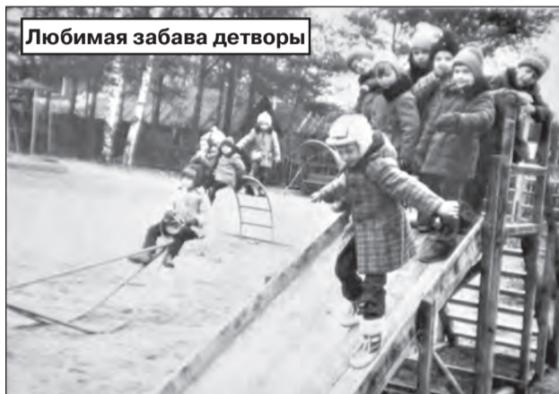
Любимая забава детворы