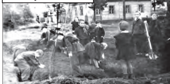
1960-е гг. Ученики первой школы на субботнике