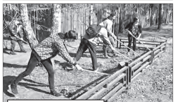
2014 г. Акция «Обелиск».