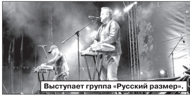
Выступает группа «Русский размер».