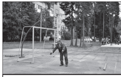
Готовится к открытию спортивная площадка на ул. Молодцова