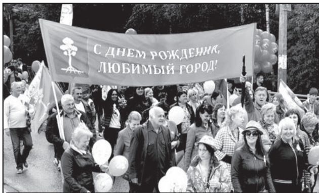
Представители администрации и учреждений.