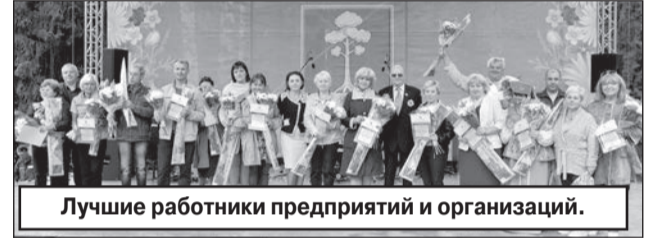
Лучшие работники предприятий и организаций.