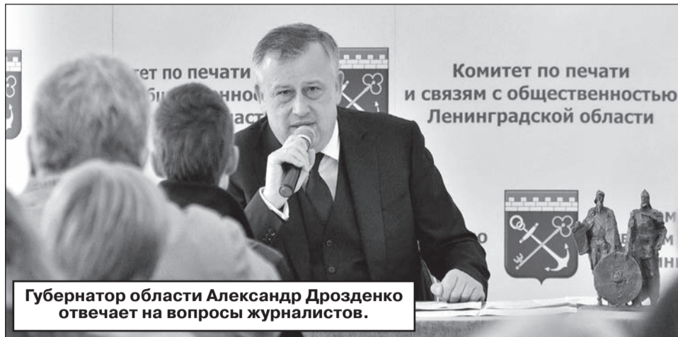
Губернатор области Александр Дрозденко отвечает на вопросы журналистов.