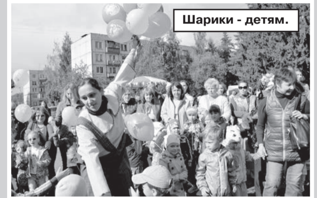
Шарики - детям.

Праздник начался с десяти утра на городской площади, где детей, их родителей, бабушек и дедушек ждала детская развлекательная интерактивная программа с участием клоунов, ростовых кукол и артистов цирка. Здесь каждый мог найти себе развлечение по возрасту и по душе: попрыгать на огромных батутах, покататься на пони, полакомиться сладкой ватой и попкорном, прокатиться на различных аттракционах, принять участие в бесплатных мастер-классах, сделать аквагрим, а главное поучаствовать в весёлых детских и семейных конкурсах.