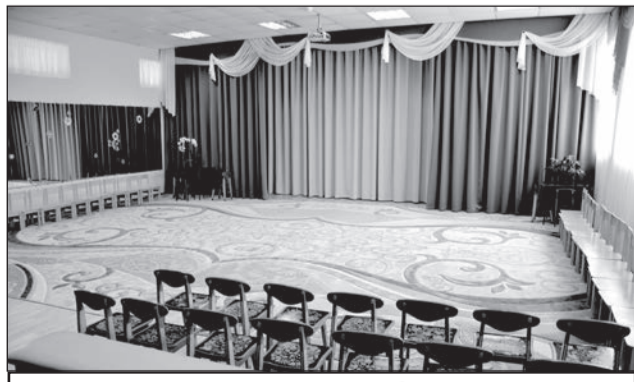
Музыкальный зал ДСКВ № 1 готов к весёлым праздникам.