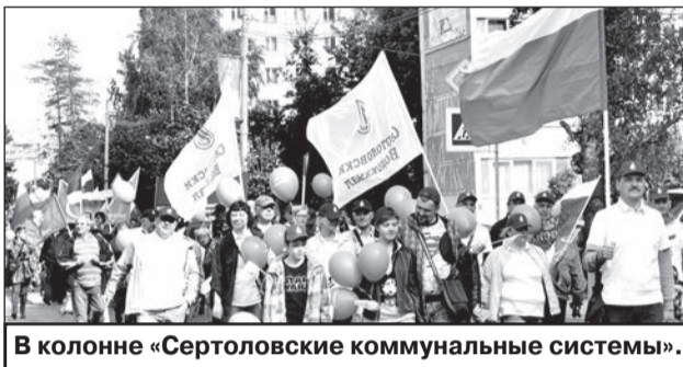
В колонне «Сертоловские коммунальные системы».