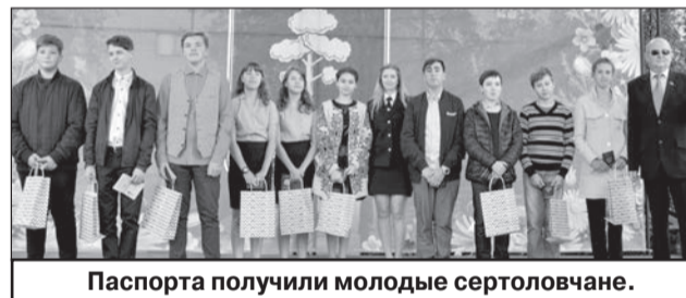
Паспорта получили молодые сертоловчане.