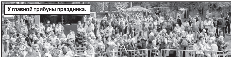
У главной трибуны праздника.