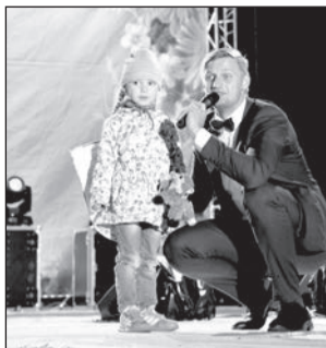
Маленькая сертоловчанка рассказывает стихи.