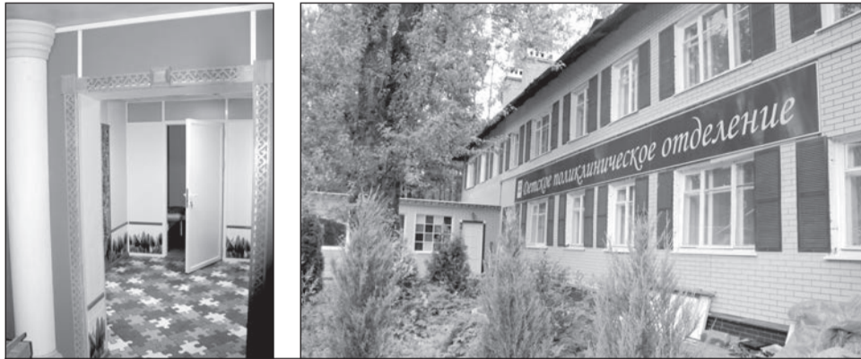
Новая поликлиника внутри и снаружи.

Пожалуй, одним из наиболее важных событий для жителей нашего города сегодня является открытие корпуса детской поликлиники на улице Школьной. Там за прошедшее время произошло немало изменений: здание бывшего детского сада сейчас не узнать. Уже практически всё готово к приёму маленьких пациентов.