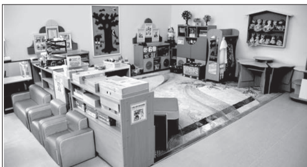
Новые игрушки и книжки в группах ДСКВ № 1.