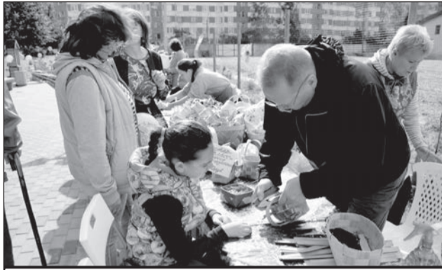
Туесок из бересты своими руками.