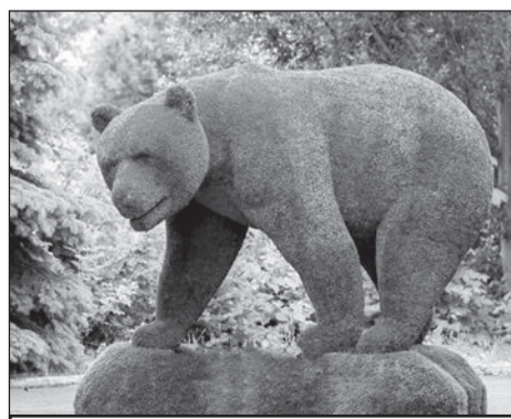
Таким будет достопримечательность у гимназии.