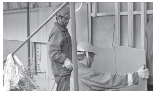
Утепление фасада д. № 2 по ул. Центральной.

Сертолово – активно развивающийся город, и один из важнейших факторов его развития – строительство нового жилья. В частности, на территории города в настоящее время реализуется несколько проектов строительства малоэтажных жилых комплексов – «Новое Сертолово», «Золотые купола», «Чистый Ручей». Однако реализация подобных проектов требует и изменения инженерно-транспортной инфраструктуры. Ни для кого не секрет, что одной из главных «дорожных» проблем в городе является отсутствие какого-либо регулирования движения в районе въезда в «Новое Сертолово» с автомобильной дороги «Парголово-Огоньки», что создаёт большую опасность для водителей и пешеходов, в том числе детей. Поэтому была проведена немалая работа, результатом которой стала реализация проекта реконструкции примыкания к автомобильной до-