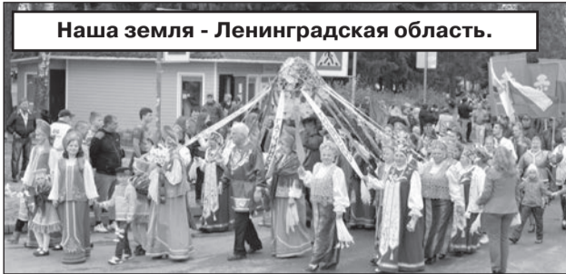
Наша земля - Ленинградская область.