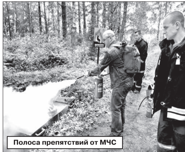
Полоса препятствий от МЧС