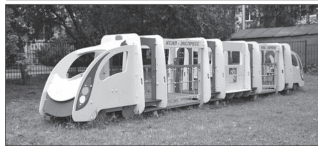
Новый комплекс для малышей ДСКВ № 2.