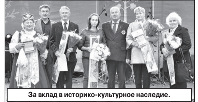
За вклад в историко-культурное наследие.

что каждый её номер сочинил в себе хореограф, изумительные костюмы и, конечно, живую музыку.