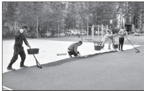
Покрытие новой волейбольной площадки на ул. Молодцова.