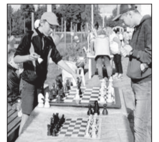
Урок игры в шахматы.

самбль казачьей песни «Кунаки» не закончил своё эмоциональное выступление. Ведь без зритель-