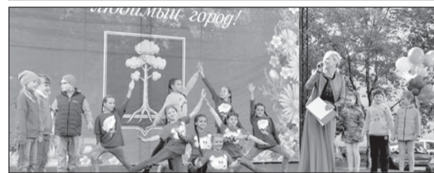
Танцевальный подарок городу.