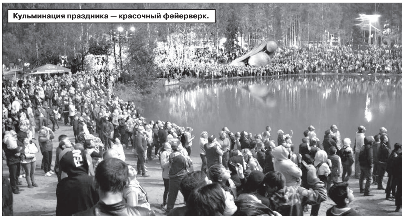
Кульминация праздника — красочный фейерверк.