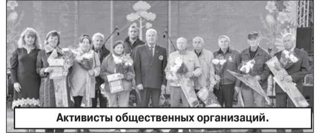
Активисты общественных организаций.