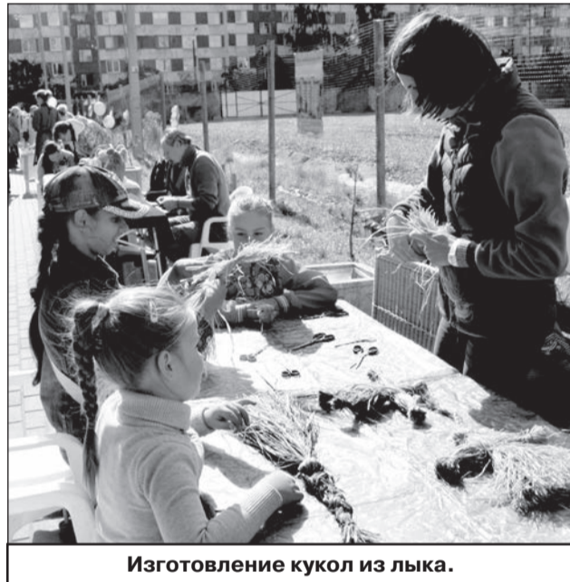
Изготовление кукол из лыка.

Весёлая и насыщенная событиями программа на Аллее мастеров заверша-