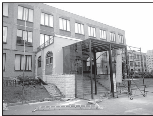
Обновление парадного входа второй школы.

Вторая школа ждёт своих учащихся, а малышей – дошкольное учреждение и желает им и их родителям всего самого хорошего, позитив-