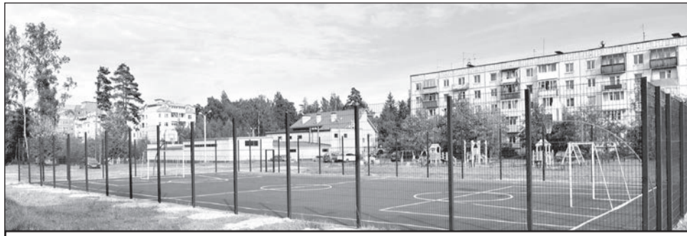
Спортивная площадка на улице Заречной.