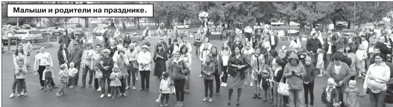
Малыши и родители на празднике.

ПРАЗДНИК СТАРТОВАЛ В 10:00 УТРА НА ПЛОЩАДИ ЗА ЗДАНИЕМ АДМИНИСТРАЦИИ. ЗДЕСЬ САМЫХ МАЛЕНЬКИХ ЖИТЕЛЕЙ ОЖИДАЛА РАЗВЛЕКАТЕЛЬНАЯ ПРОГРАММА С УЧАСТИЕМ АНИМАТОРОВ ИЗ САНКТ-ПЕТЕРБУРГА.