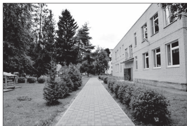
Новая тротуарная плитка во дворе ДСКВ № 2.

Материал подготовила Виктория МЕЛЬНИК