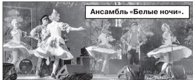
Ансамбль «Белые ночи».

Пётр КУРГАНСКИЙ