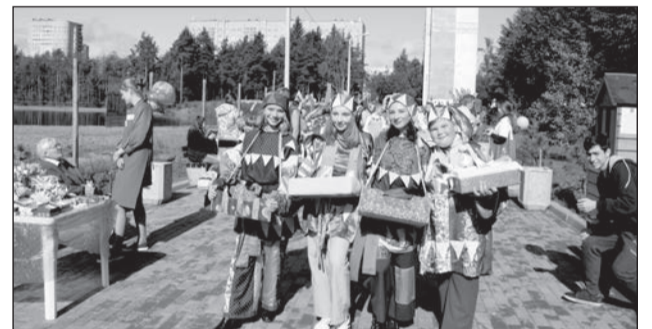
Скоморохи зазывают народ на мастер-классы.