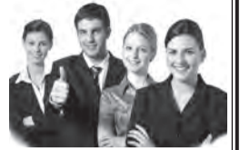
График работы сменный, корпоративное питание, компенсация питания.

Обращаться по телефону: 8-921-592-76-75, с 10.00 до 19.00