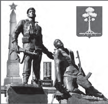
МУНИЦИПАЛЬНОЕ ОБРАЗОВАНИЕ СЕРТОЛОВО

Подарок на 8 Марта своими руками 19 стр. НЕОБЫЧНАЯ 3D ОТКРЫТКА