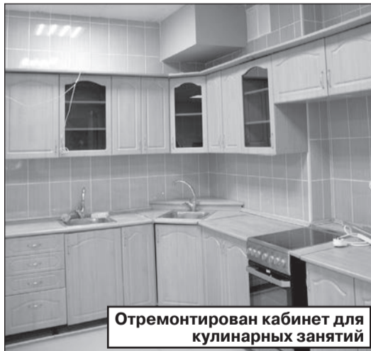
Отремонтирован кабинет для кулинарных занятий