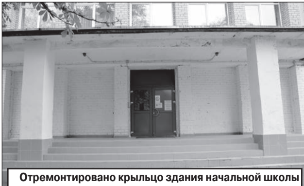
Отремонтировано крыльцо здания начальной школы