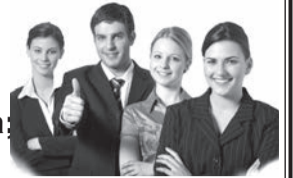
График работы сменный, корпоративное питание, компенсация питания.

Обращаться по телефону: 8-921-592-76-75 , с 10.00 до 19.00