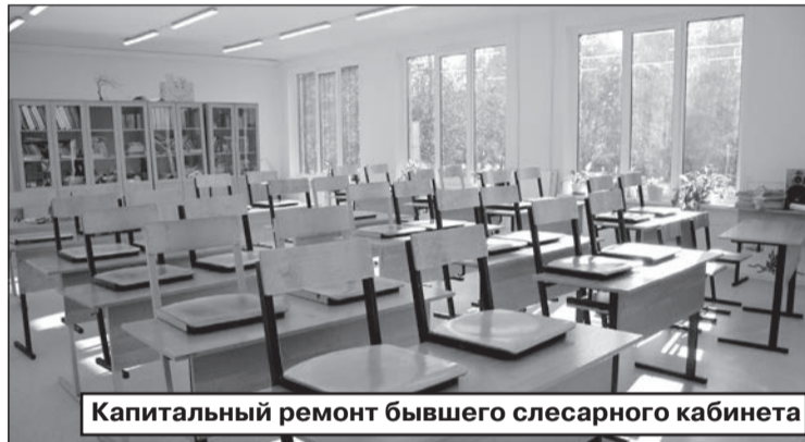
Капитальный ремонт бывшего слесарного кабинета