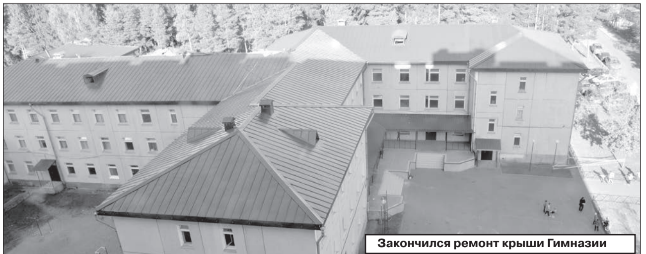
Закончился ремонт крыши Гимназии