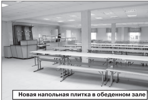
Новая напольная плитка в обеденном зале