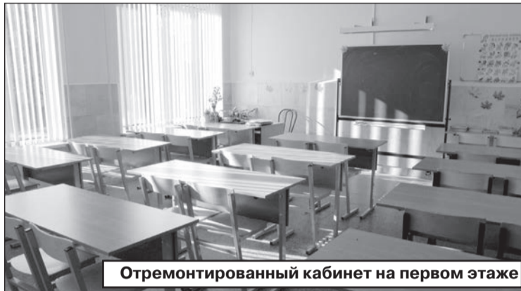
Отремонтированный кабинет на первом этаже