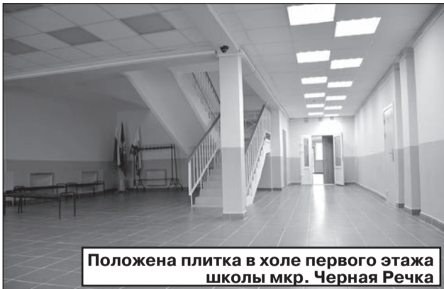
Положена плитка в холе первого этажа школы мкр. Черная Речка