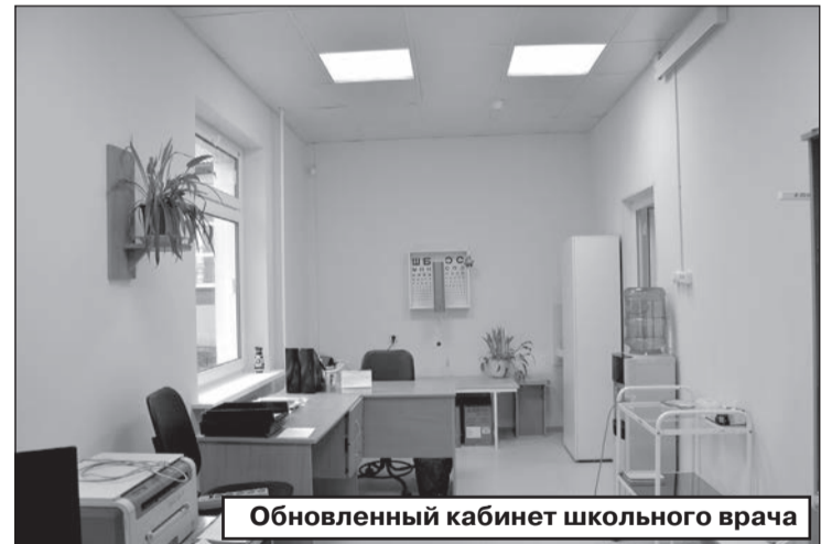
Обновленный кабинет школьного врача