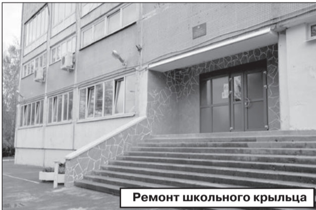
Ремонт школьного крыльца