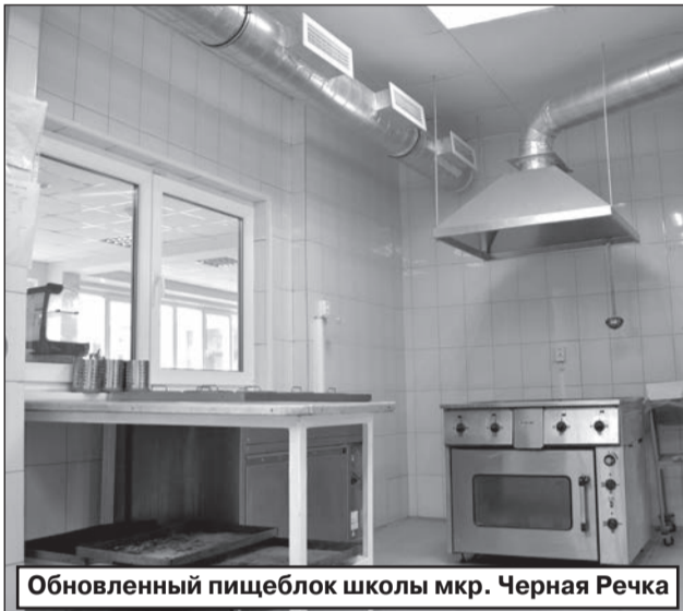
Обновленный пищеблок школы мкр. Черная Речка