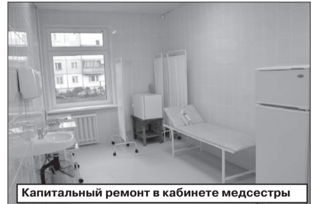
Капитальный ремонт в кабинете медсестры