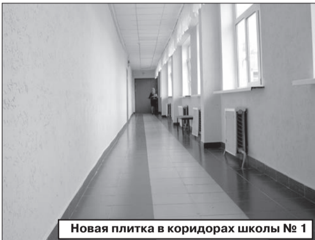
Новая плитка в коридорах школы № 1