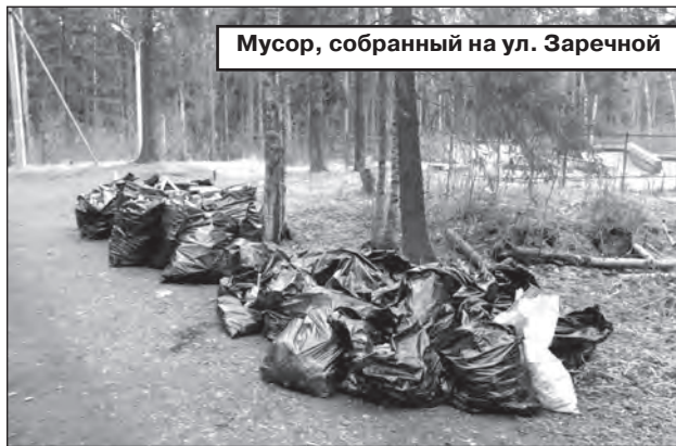
Мусор, собранный на ул. Заречной