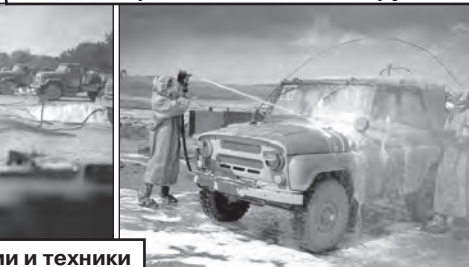
Дезактивация территории и техники