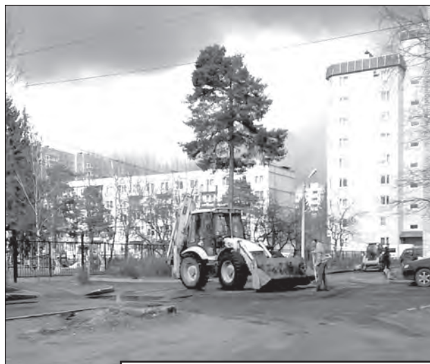
Подготовка к ямочному ремонту