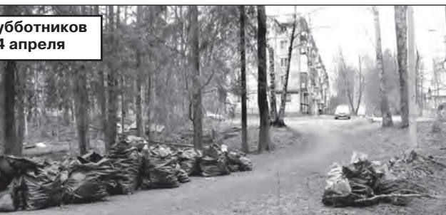
Итоги субботников 23-24 апреля