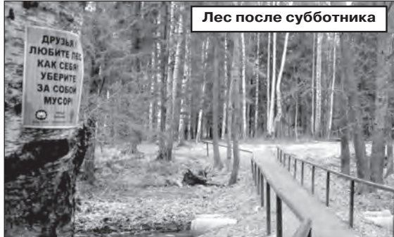
Лес после субботника

29 АПРЕЛЯ, В РАМКАХ МЕСЯЧНИКА ПО БЛАГОУСТРОЙСТВУ, СОСТОИТСЯ ТРАДИЦИОННЫЙ ГОРОДСКОЙ ВЕСЕННИЙ СУББОТНИК , в котором примут участие сотрудники администрации, городских предприятий и организаций. Они будут убирать лесопарковые и другие зоны, в том числе и популярные у любителей пикников места.