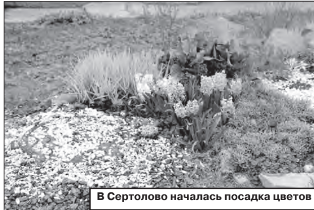
В Сертолово началась посадка цветов