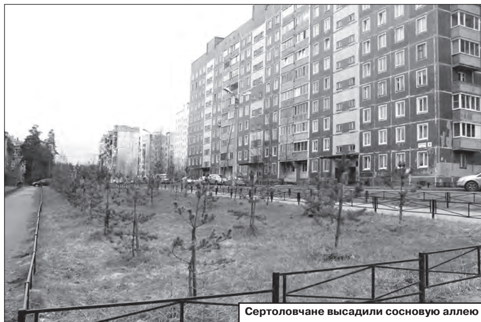
Сертоловчане высадили сосновую аллею