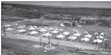
Палаточный городок ликвидаторов из Ленинградского военного округа