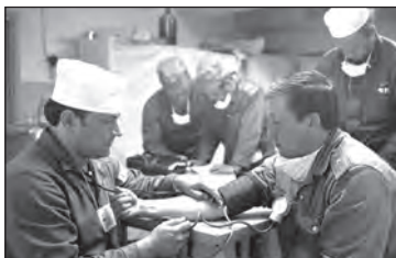
Врачебный контроль вернувшихся из зараженной зоны