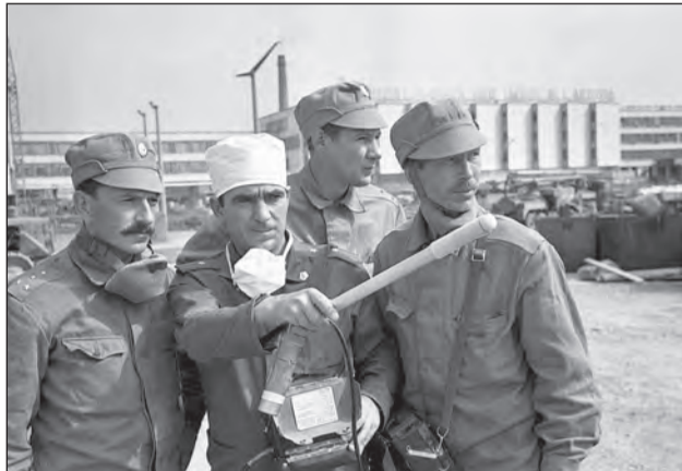
Военнослужащие ЛенВО во время замера радиоактивного фона вблизи станции