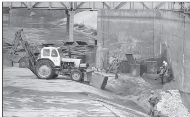
Дезактивация в районе 4 блока ЧАЭС.

Особо хочется отметить, что ныне кое-кто стал забывать уроки истории. В независимой Украине может случиться новая беда. Нынешние власти на волне антироссийской истерии отказываются закупать в нашей стране ядерное топливо для эксплуатируемых у них АЭС и пытаются заманить его на американское. А, как утверждают эксперты, оно по своим параметрам не подходит для станций,