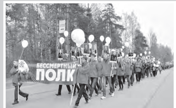
«Бессмертный полк» в Сертолово 9 Мая 2015 г.