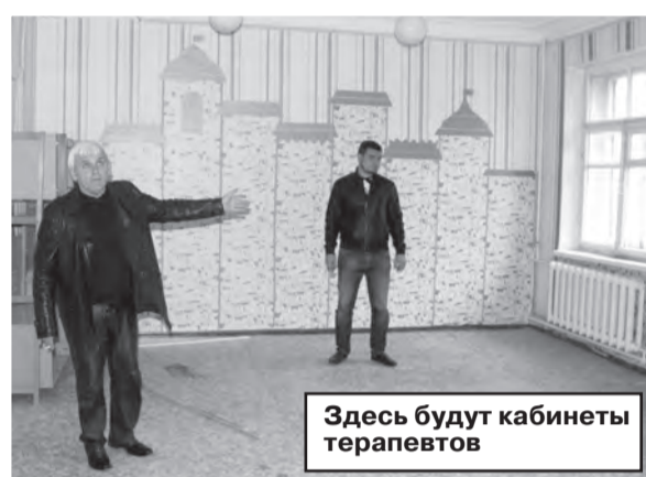
Здесь будут кабинеты терапевтов

Отделения городской больницы в микрорайоне Черная Речка планируется открыть уже в августе, ко Дню города. Для того чтобы все работы были выполнены в положенный срок, рабо-