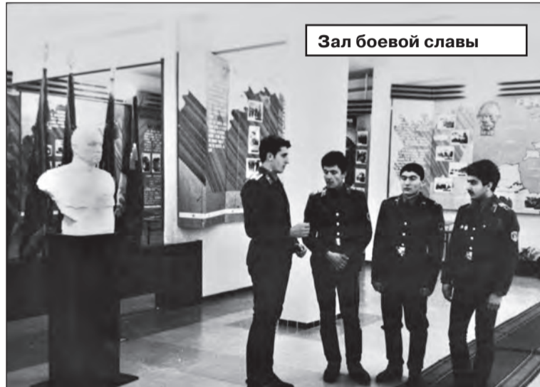
Зал боевой славы