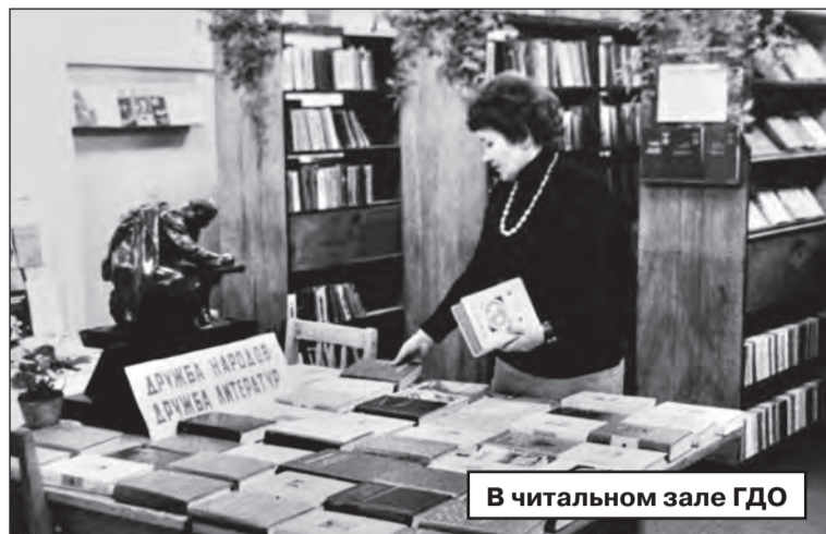
В читальном зале ГДО

Более пяти лет назад Дом офицеров был закрыт Министерством обороны РФ. Только спустя длительное время появилась надежда на то, что он снова откроет свои двери сертоловчанам. Местная власть сообщает – скоро начнутся ремонтно-восстановительные работы здания ГДО.