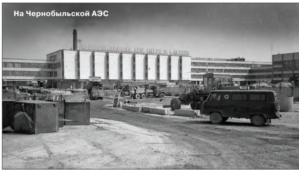
На Чернобыльской АЭС