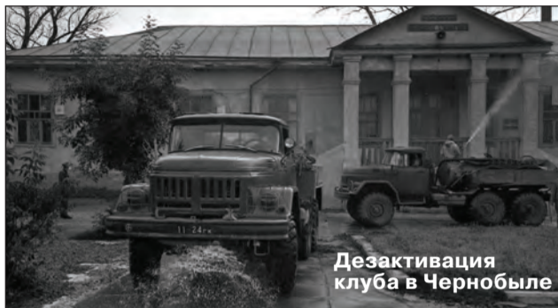
Дезактивация клуба в Чернобыле

Совет депутатов МО Сертолово Администрация МО Сертолово Общественная организация «Союз Чернобыль»