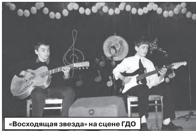
«Восходящая звезда» на сцене ГДО