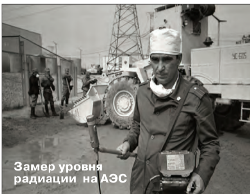
Замер уровня радиации на АЭС