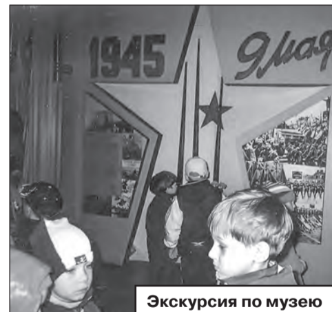
Экскурсия по музею