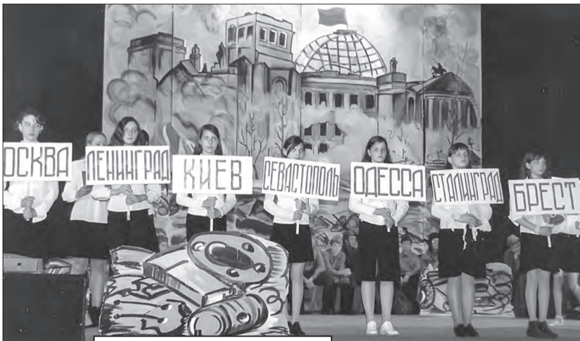
День Победы на сцене ГДО