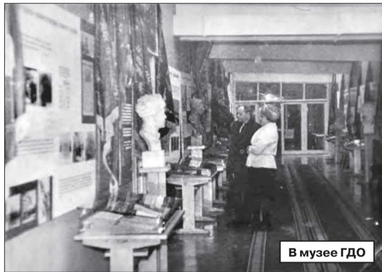
В музее ГДО