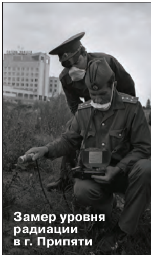
Замер уровня радиации в г. Припяти