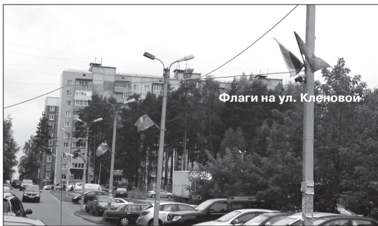
Флаги на ул. Кленовой

- Городские службы и совет депутатов МО Сертолово ведут активную работу с обращениями жителей Сертолово, и в этом направлении сделано многое. Например, по заявке жителей ул. Кленовая спилены три сухих дерева, а осенью на их месте будут высажены новые. За д. 6 по ул. Ларина были убраны щебень и песок, в ближайшем будущем будет удален цемент с пешеходной дорожки, а территория будет благоустроена. Ведется работа по заявкам сертоловчан относительно ремонта асфальтобетонного покрытия, устройства тротуаров, декоративных