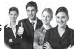
График работы сменный, корпоративное питание, компенсация питания.

Обращаться по телефону: 8-921-592-76-75, с 10.00 до 19.00