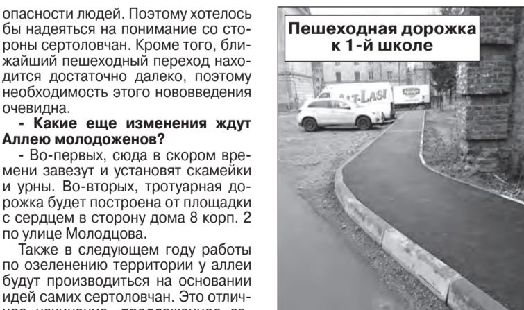
Пешеходная дорожка к 1-й школе

опасности людей. Поэтому хотелось бы надеяться на понимание со стороны сертоловчан. Кроме того, ближайший пешеходный переход находится достаточно далеко, поэтому необходимость этого нововведения очевидна.