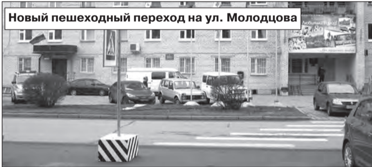
Новый пешеходный переход на ул. Молодцова

Подрядная организация уже установила дорожные знаки, также нанесена разметка пешеходного перехода от администрации к входу на аллею, чтобы молодоженам было удобно подходить к достопримечательности. Также при входе будут установлены бетонные полусферы, которые позволят оставить это место свободным от паркующихся машин. Все делается для удобства и без-